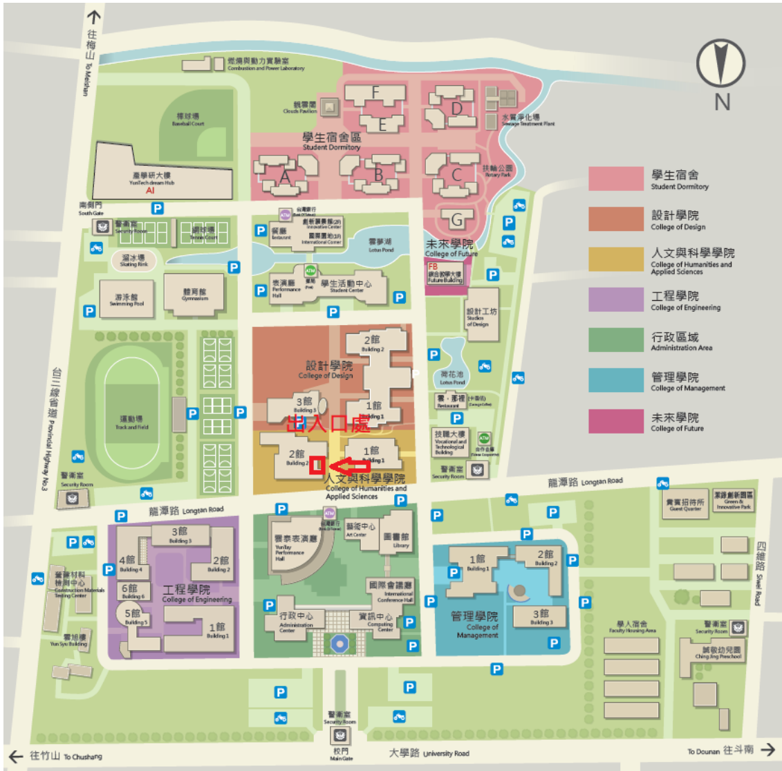
【以下為人文與科學學院放大圖示】